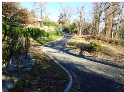
chemin de Bals