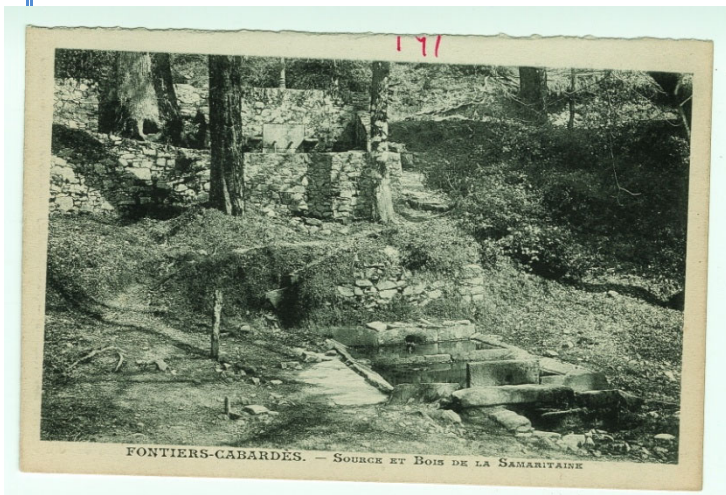
tableau de Jacques Ourtal

« ... dans son œuvre abondante il oppose le mirage de la couleur à la pureté des lignes où la lumière rivalise avec les formes en d'éclatantes vibrations ».