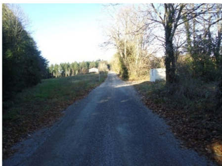
Allée du stade

Les travaux, suite à appel d'offres ont été confiés à l'Entreprise STPR de TREBES pour un montant total des travaux de 133 302. 33 € TTC, subventionnés par L'ETAT pour un montant de 68 806.00 € et par le Département et la Région pour un montant de 38 000.00€, qui représente une aide de 80 % environ.