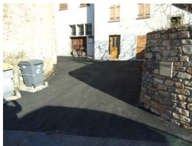
rue du Lavoir