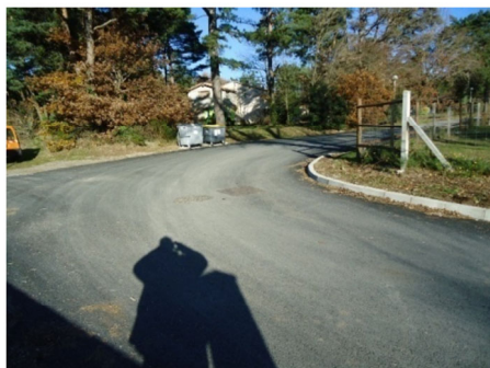
Allée du stade