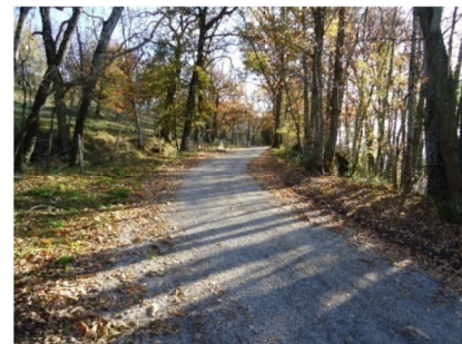
Chemin du Cammas de Bonnet