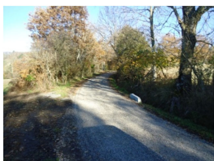
chemin de Cantegraille