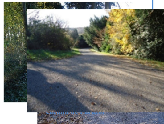
Allée du cimetière