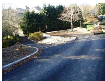
Impasse du lavoir couvert

Par ailleurs il est prévu également pour cette année la réfection de l'ensemble des rues et des trottoirs et des stationnements sur le lotissement de Plaisance.