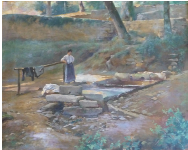
carte postale ancienne

Jacques Ourtal est un peintre audois né à Carcassonne le 8 octobre 1868 d'un père peintre de bâtiments et décorateur de chapelles,, puis peintre en décors, et mort le 23 septembre 1962 . Il était spécialiste de grandes compositions décoratives à thème historique ou religieux. Il a beaucoup peint les paysages de l'Aude et de l'Ariège.