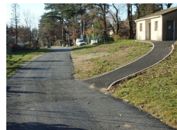
Allée du stade

Dans le cadre du programme d'aménagement d'accessibilité aux personnes à mobilité réduite, l'accès aux vestiaires a été aménagé.