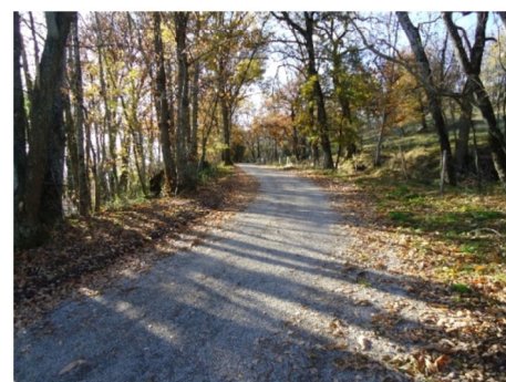
Chemin du Colombier

RD 203 Aménagement d'un trottoir qui permet de canaliser les eaux de pluie, de stabiliser le talus et d'éviter la chute de véhicules lors d'une sortie de route