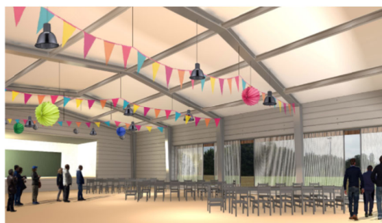
Vue de l'intérieur