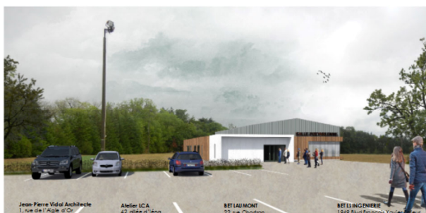
Vue de l'extérieur

L'agence d'Architectes VIDAL a été retenue pour élaborer la demande de permis de construire