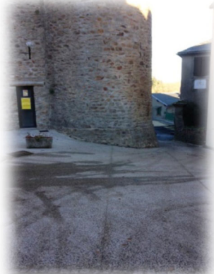
Tour de l'Horloge