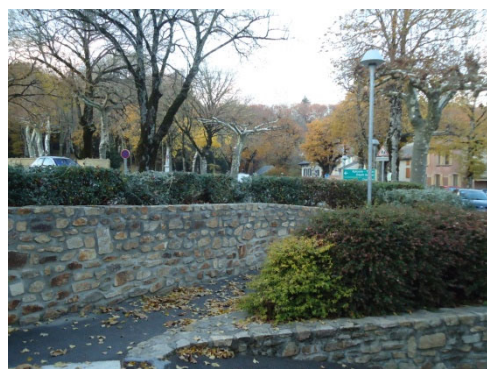
taille de massifs