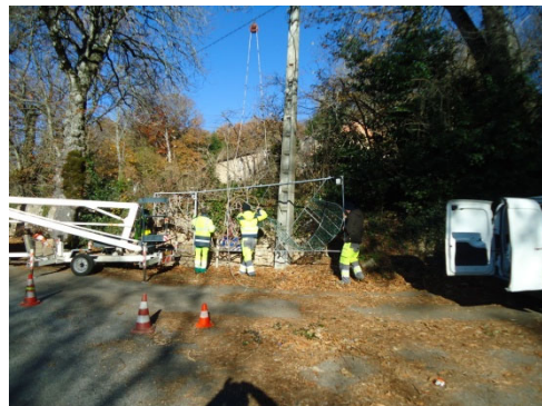
pose de décorations de Noël