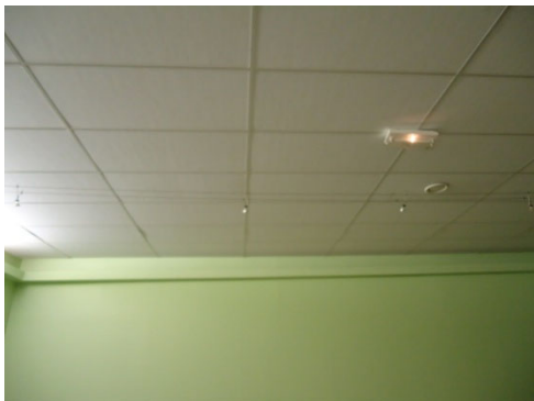
Remplacement dalles plafond au foyer