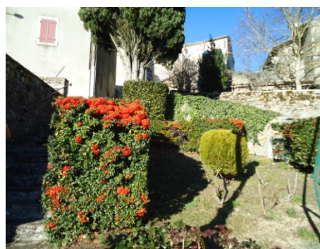
massifs près de l'église