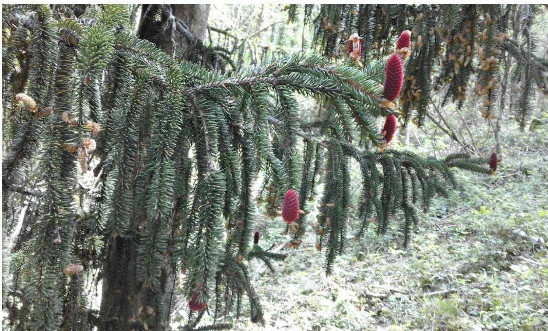
Abies pinsapo , sapin d'Espagne