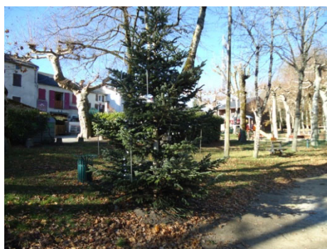
Socle pour le sapin de Noël