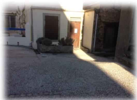
Rue Paul Riquet

La deuxième tranche de travaux concerne les rues de La CARRIERRASSE, la rue JACQUES OURTAL, et la rue PAUL RIQUET. Elle sera réalisée en début d'année prochaine.