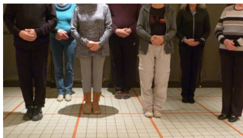
Quelques pratiquants, les mains posées sur le "Dan Tian"

Thé / Temps d'échanges avant l'Au Revoir