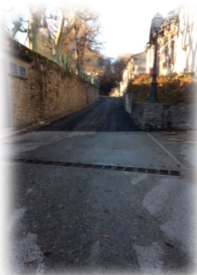
Rue du Donjon