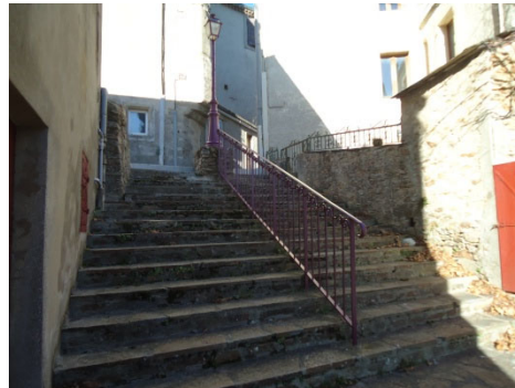
peinture sur rampes et luminaires