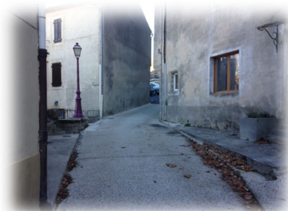
Rue du Château