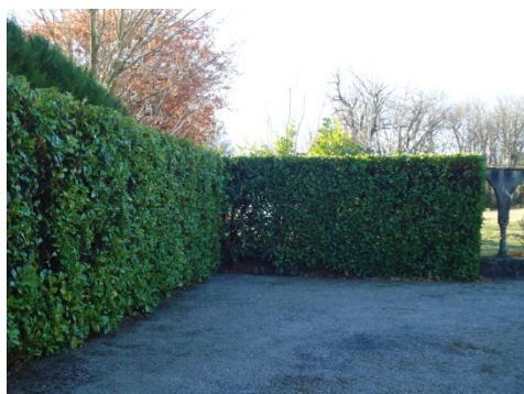
Taille de haies au cimetière